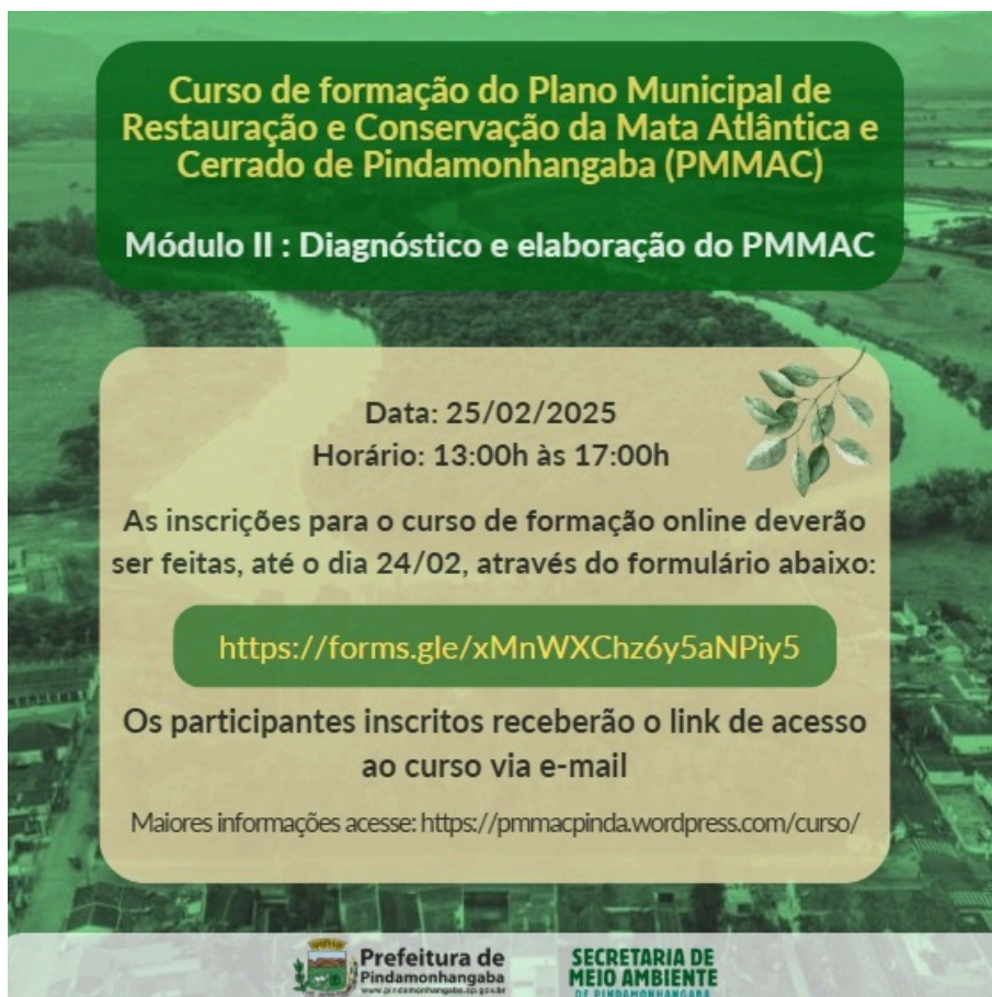
Figura 1-1 Divulgação do curso pela prefeitura por mensagens eletrônicas (e-mail e WhatsApp)

Este material circulou entre os membros e organizações que compõem o GT e o CONDEMA, além de listas e grupos de interesse por parte da Secretaria do Meio Ambiente. A chamada foi replicada por algumas destas organizações em suas próprias redes, o que ampliou o seu alcance. O curso foi aberto a participantes previamente inscritos, através de formulário eletrônico.