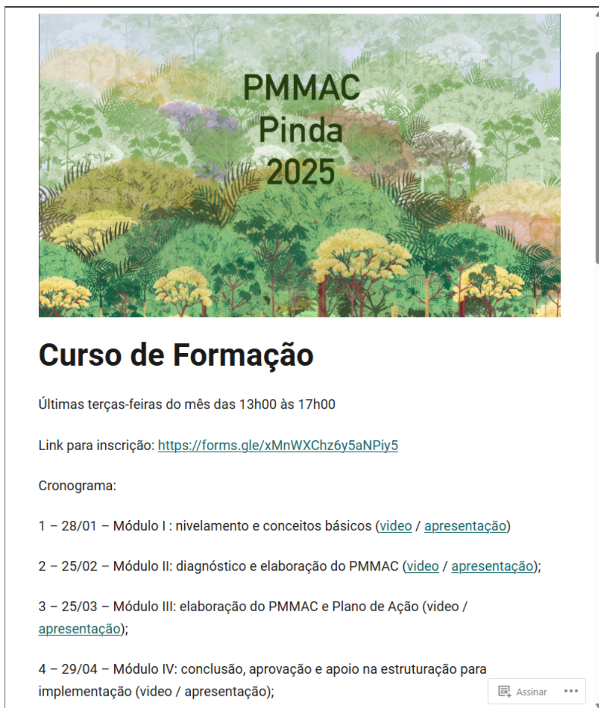
Figura 1-2 Seção sobre o curso de formação na página do PMMAC