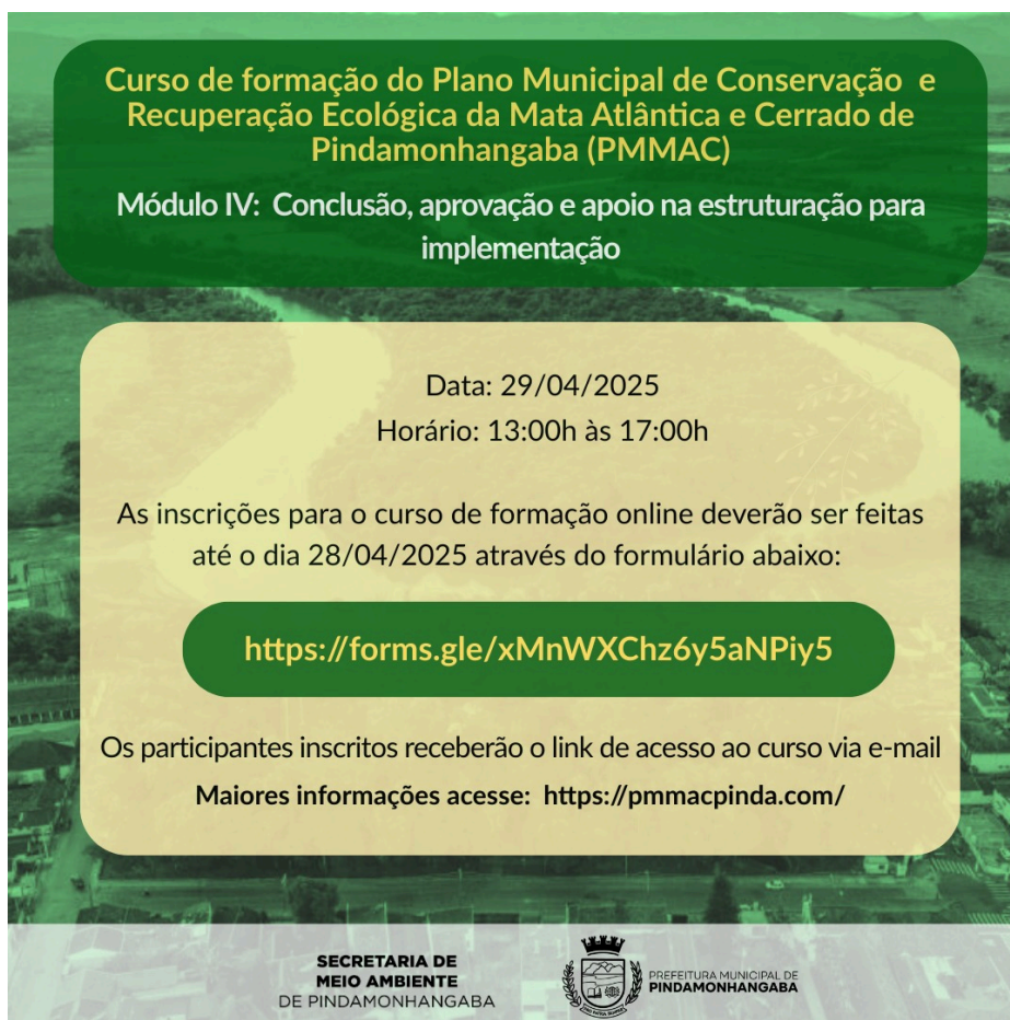
Figura 1-1 Divulgação do curso pela prefeitura por mensagens eletrônicas (e-mail e Whatsapp)

Este material circulou entre os membros e organizações que compõem o GT e o CONDEMA, além de listas e grupos de interesse por parte da Secretaria do Meio Ambiente. A chamada foi replicada por algumas destas organizações em suas próprias redes, o que ampliou o seu alcance. O curso foi aberto a participantes previamente inscritos, através de formulário eletrônico.