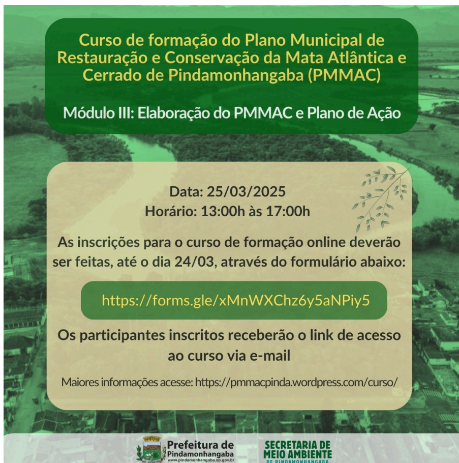
Figura 1-1 Divulgação do curso pela prefeitura por mensagens eletrônicas (e-mail e Whatsapp)

Este material circulou entre os membros e organizações que compõem o GT e o CONDEMA, além de listas e grupos de interesse por parte da Secretaria do Meio Ambiente. A chamada foi replicada por algumas destas organizações em suas próprias redes, o que ampliou o seu alcance (figura 1-3). O curso foi aberto a participantes previamente inscritos, através de formulário eletrônico.