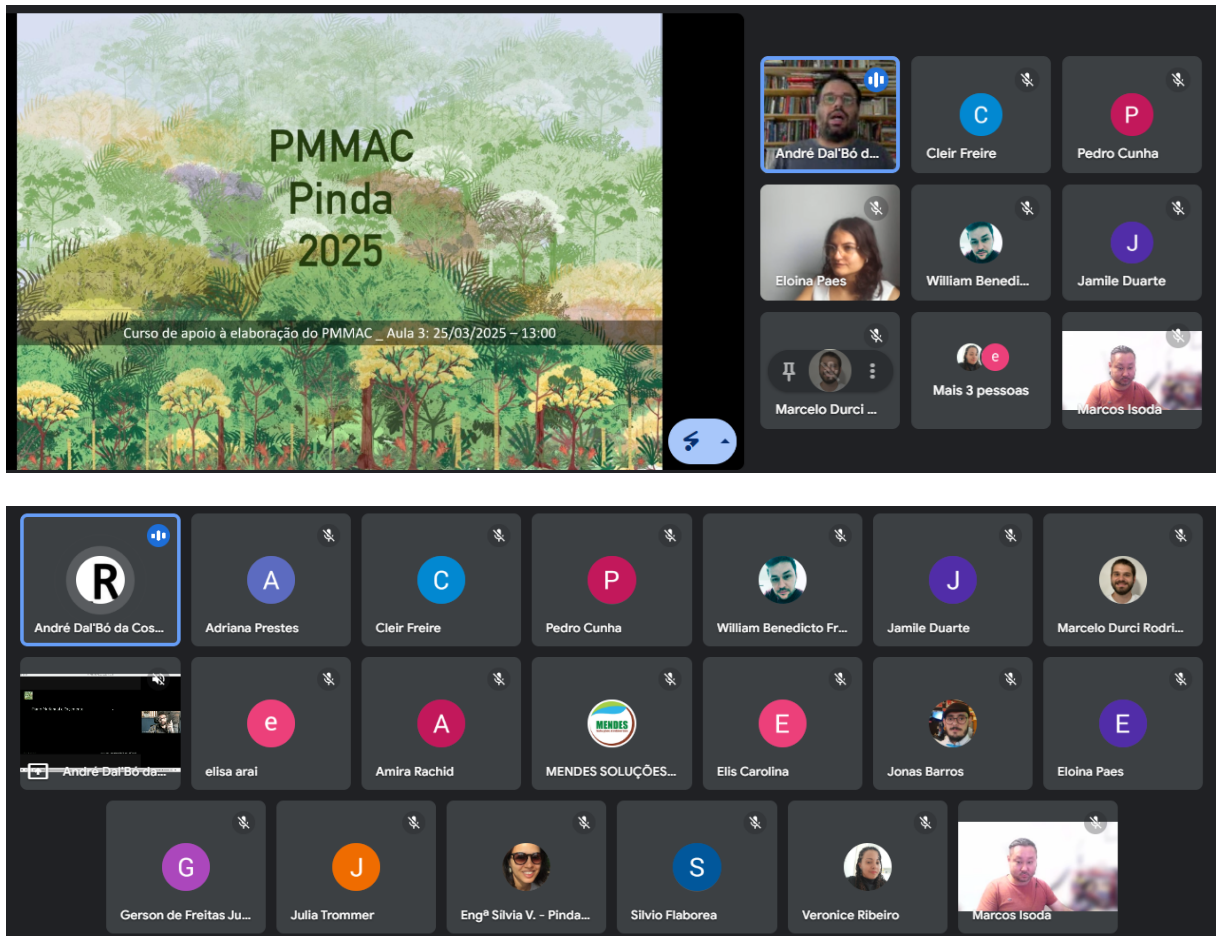
Figura 1-4 Realização do curso por modo remoto (plataforma Google Meets)