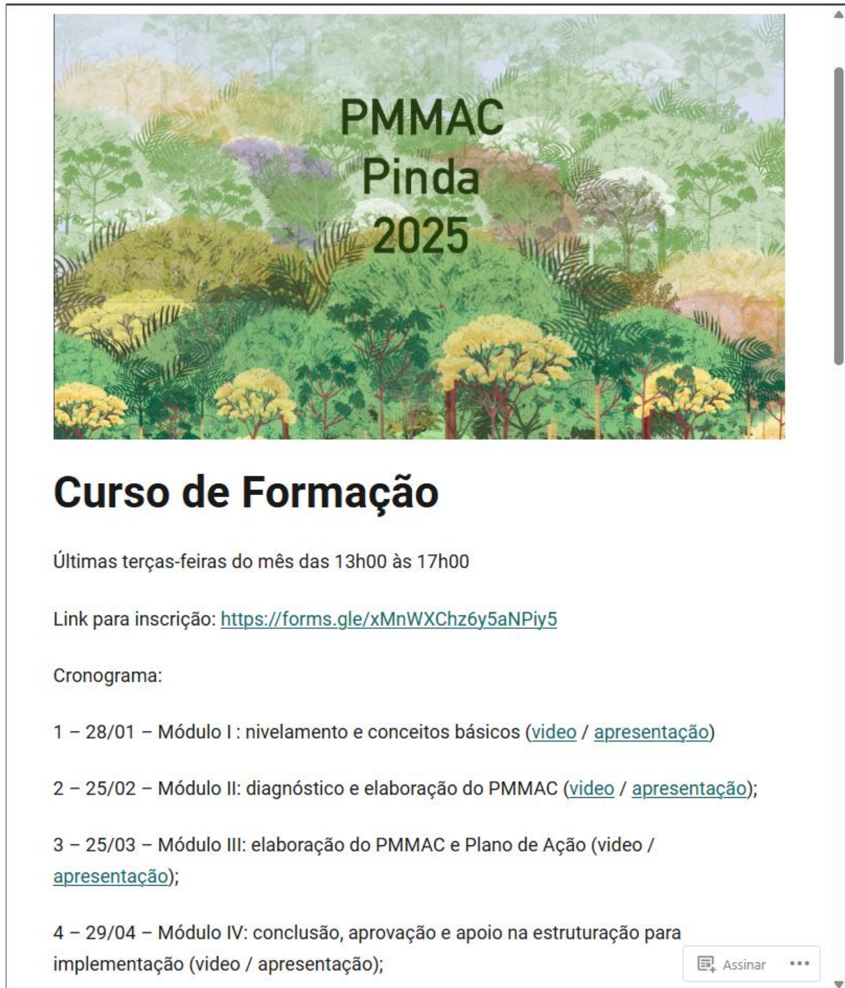
Figura 1-2 Seção sobre o curso de formação na página do PMMAC