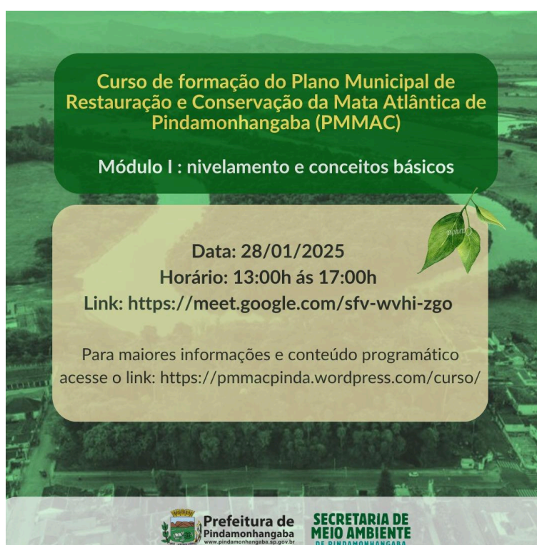
Figura 1-1 Divulgação do curso pela prefeitura por mensagens eletrônicas (e-mail e WhatsApp)

Este material circulou entre os membros e organizações que compõem o GT e o CONDEMA, além de listas e grupos de interesse por parte da Secretaria do Meio Ambiente. A chamada foi replicada por algumas destas organizações em suas próprias redes, o que ampliou o seu alcance (Figuras 1-3 e 1-4).